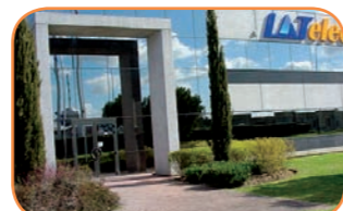
> Siège de LATelec à Labège > Labège Head quarter

En janvier, la Direction Ingénierie de LATelec est créée à Labège. Celle-ci inclut les études (maquettes numériques et schématiques) et les bancs de test électrique. Elle pilote le service informatique. In January, creation of LATelec Engineering Department in Labège. This included design (digital mock-ups and schematics) and electrical test benches. It was also put in charge of the IT department.