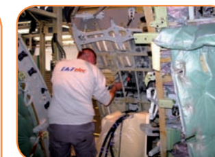
> Activité maintenance pour LATelec Services > Maintenance activity for LATelec Services

Le 1er janvier, la SLE -Société Landaise d'Électronique-, unité spécialisée dans la production de harnais pour Falcon, basée à Liposthey dans les Landes, rejoint le groupe LATelec. En avril, une 2 nd e unité de production voit le jour en Tunisie à Fouchana. Elle vient doubler la capacité de production de LATelec sur le territoire tunisien. En septembre, LATelec Services regroupe sur le site de Cugnaux toutes les personnes qui travaillent dans le domaine du service aéronautique. LATelec Services gagne en visibilité et intervient notamment sur les installations en chaînes d'assemblage (FAL) et essai en vol (FTI) et sur la maintenance d'aéronef. January 1, SLE - Société Landaise d'Électronique - a company specialized in the production of harnesses for the Falcon, based in Liposthey in the Landes, joined the LATelec group. In April, a second production unit saw the light of day at Fouchana in Tunisia, doubling LATelec production capacity in Tunisia. In September, LATelec Services grouped together everyone working in the area of aeronautical services on its Cugnaux site. LATelec Services gained in visibility and now works, in particular, on the Final Assembly Line (FAL) and Flight Test (FTI) installations and on aircraft maintenance.