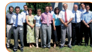
> Une équipe à votre service > A team at your service