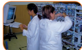
> Câblage meuble avionique A380 > A380 avionics bay wiring

Airbus confie à LATelec la prise en charge complète et directe de 4 meubles qui accueilleront les principaux calculateurs avioniques de l'A380. Le résultat sera spectaculaire : 45 000 liaisons électriques pour 25 kms de câblage. Airbus gave LATelec complete and direct responsibility for four racks that are to house the A380's main avionics computers. The result will be spectacular: 45,000 electrical connections for 25 kms of wiring.